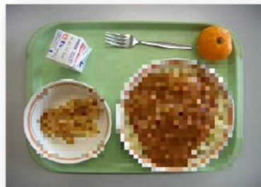
きゅうしよくの「みみずすばげっい」