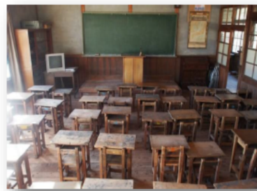
レトロなきょうしつで「しゅぎょう」もはかどります!

みなさま、ごきげんいかがですか。 このたびしょうがっこうをつくりました。 こうちょうは、だんなさまの 「とんだあまん」におねがいしました。 わたしの、たいけんうれし おもっています。 みなさまにあえることを たのみをしていますわ。